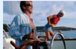
●ヨット、クルーザー