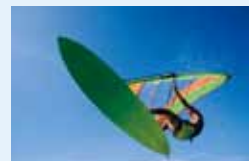
●ウィンドサーフィン