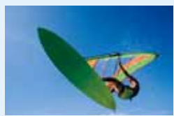
●ウィンドサーフィン