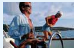
●ヨット、クルーザー